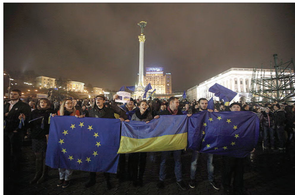
22 листопада 2013 року. Акція на Майдані Незалежності за євроінтеграцію.