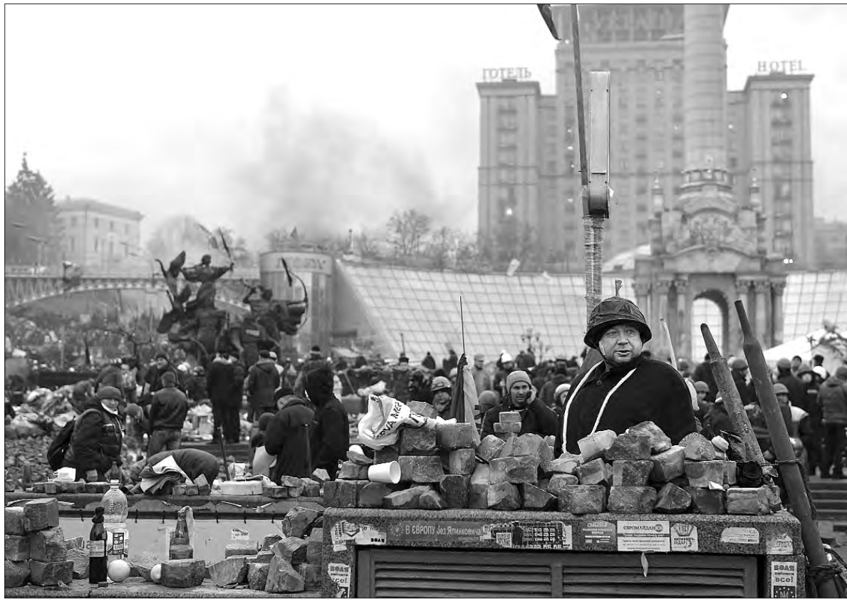
20 лютого 2014 року. Київ. Під час протистояння на Євромайдані.

Щорічні поїздки українських делегацій у левашово, далі у медвеж'єгорськ, де було управління біломорканалу нквс, і на сам канал, який заручники кремля, а серед них і професори, і священники, й українські заможники, будували в граніті кайлами (за різними даними тут загинуло 200 тисяч осіб, тіла яких часто кидали у бетономішалки, бо їх ніхто не вивозив і не ховав похристиянськи), а потім у сандармох, де ще одне меморіальне кладовище жертв комуністичного терору, і на солонки — насправді були передсловом Майданів. Цих всеукраїнських повстань 2004 р., 2013—2014 рр. проти потворної радянщини з її концтаборами, червоним і Великим терором, знищенням і депортацією мільйонів, зневагою до Конституції й