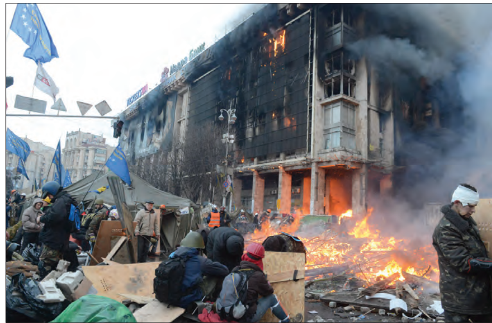
19 лютого 2014 року. Протистояння на Майдані Незалежності.