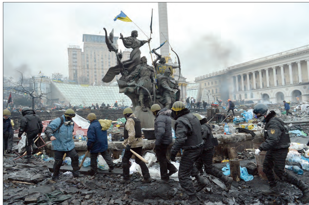
20 лютого 2014 року. Київ. Під час протистояння на Євромайдані.