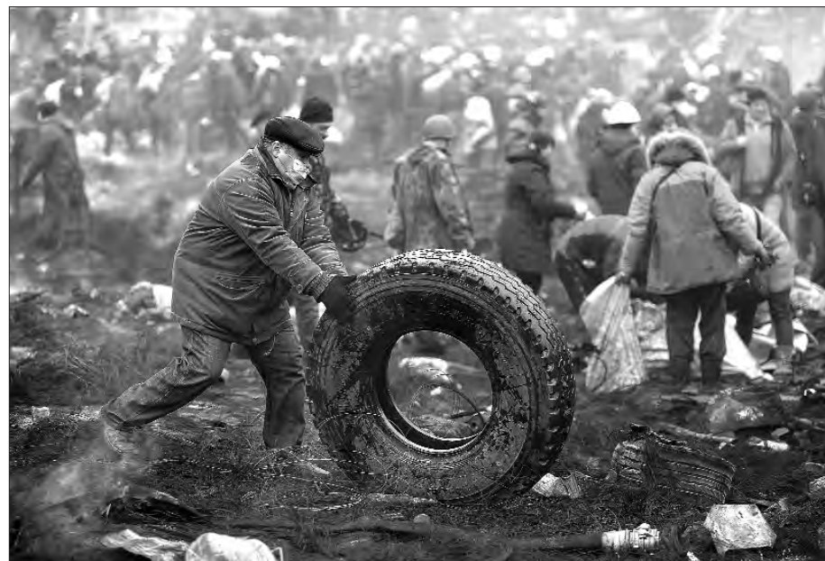
20 лютого 2014 року. Київ. Під час протистояння на Євромайдані.