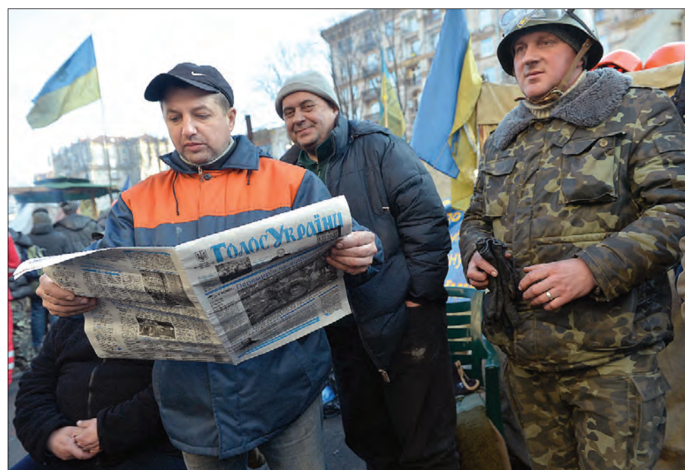
21 лютого 2014 року. Київ. «Голос України» на Євромайдані.