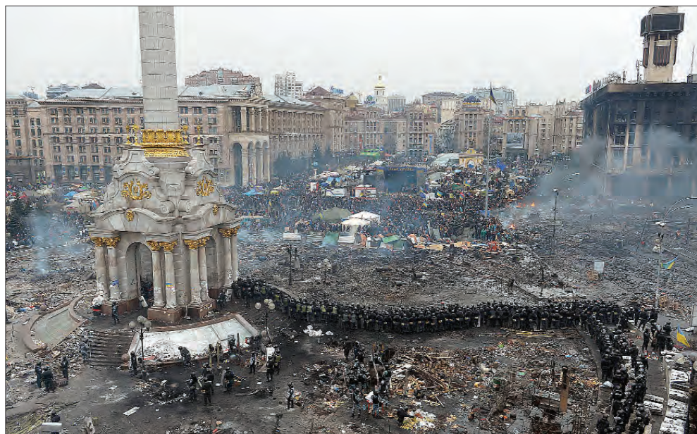
19 лютого 2014 року. Протистояння на Майдані Незалежності.