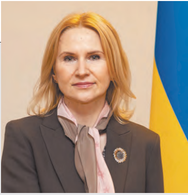
Заступниця Голови Верховної Ради України Олена КОНДРАТЮК.