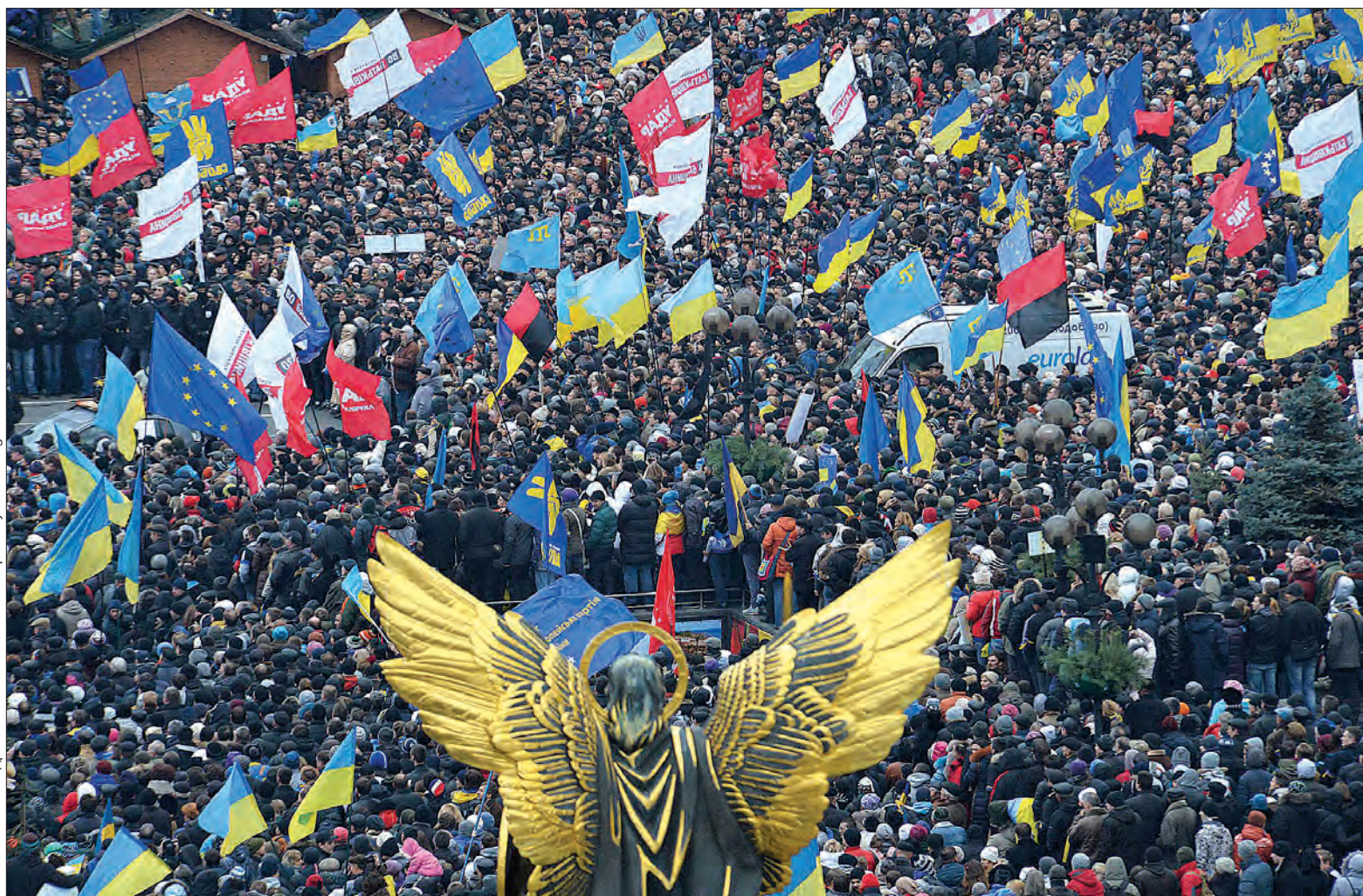
Більше фото тут — www.golos.com.ua

21 листопада 2013 року почався новий відлік історії України. У цей день сотні людей вийшли на Майдан Незалежності у Києві, аби обстоювати європейський вектор розвитку держави. За тиждень до протесту проти кримінального клану Януковича, котрий змінив курс країни із Заходу на росій, приєднались мільйони. Обстоюючи свою свободу і національну гідність, майбутнє дітей і наступних поколінь, активісти не полишали Майдан понад 90 днів. Це були місяці, сповнені перемог над цинізмом влади, щастя бути серед однодумців і патріотів,