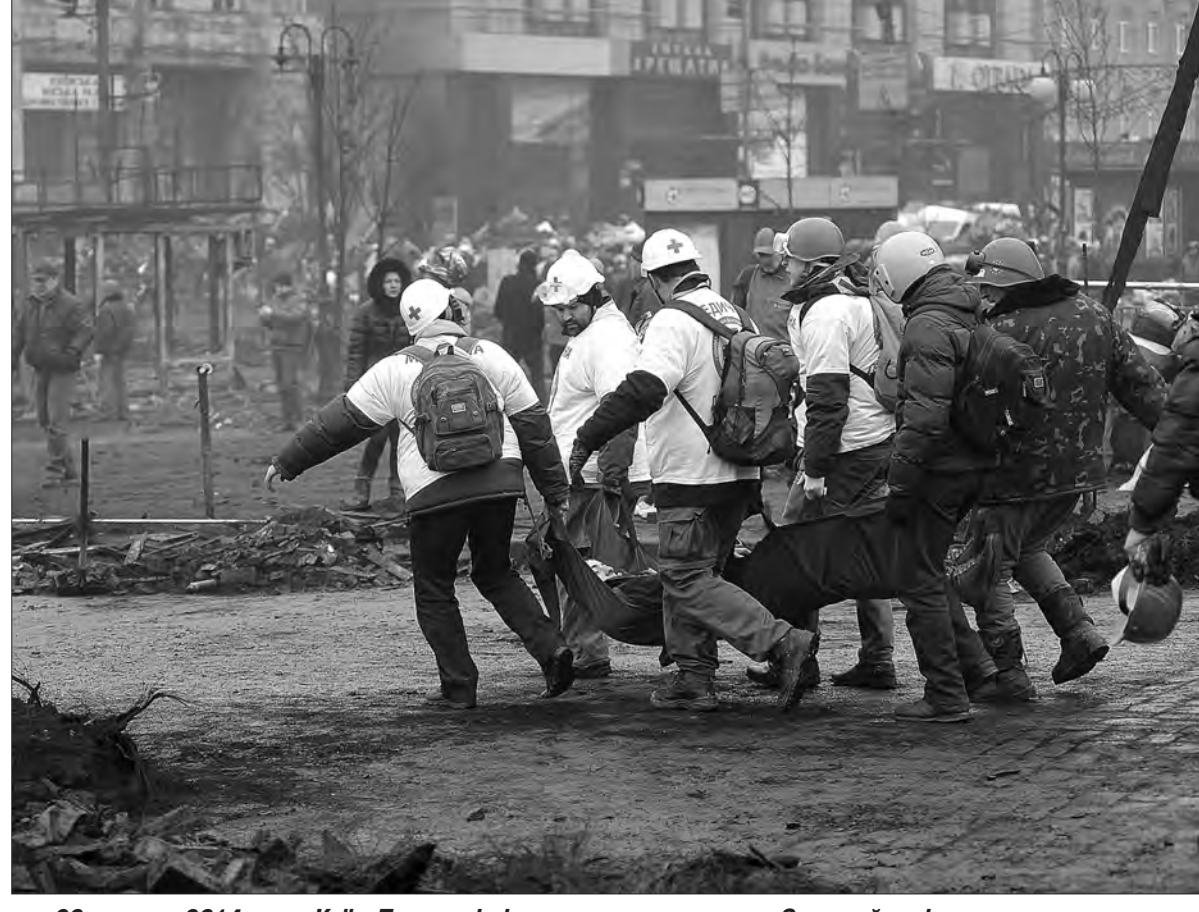
20 лютого 2014 року. Київ. Поранені під час протистояння на Євромайдані.

За статистикою, учасниками Євромайдану стали майже 10 мільйонів українців, які виходили на акції протесту у Долину, Луганську, Харкові, Миргороді, Черкасах, Львові й сотнях інших міст і сіл. Більш як половина населення України підтримувала вимоги протестувальників до влади — скасування рішення про призупинення підготовки до асоціації з ЄС, підписання Угоди про асоціацію, а у разі відмови — імпичмент президента, прийняття Верховною Радою євроінтеграційних законів, відставка уряду азарова через зраду національних інтересів. Той, хто був активістом Майдану, виходив щонеділі на віче, стояв на барикадах і ночами чатував тут, зігріваючись біля металевих бочок-грубок, добре пам'ятає, як у кухнях, що працювали в КМДА і наметах, нарізали бутерброди і розносили їх територією спротиву, а коли треба було — розбирали бруківку, носили дрова і шини професори і бізнес-леді у дорогих шубках, а разом із ними дівчата, жінки, чоловіки різних професій, різних статків і соціального статусу. Сотні тисяч людей, а 1 грудня, коли після жорсткого побиття «беркутівцями» студентів на вулиці Києва вийшов, за деякими даними, мільйон протестувальників (людська річка захлестнула бульвар Шевченка, Хрещатик, Майдан Незалежності та навколишні вулиці — Інститутську, Грушевського, Прорізну) об'єднувало одне — прагнення