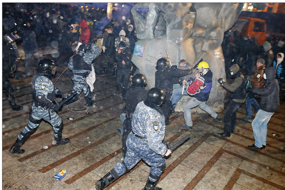
30 листопада 2013 року. Бійці спецпідрозділу «Беркут» розганяють учасників акції на Майдані Незалежності.