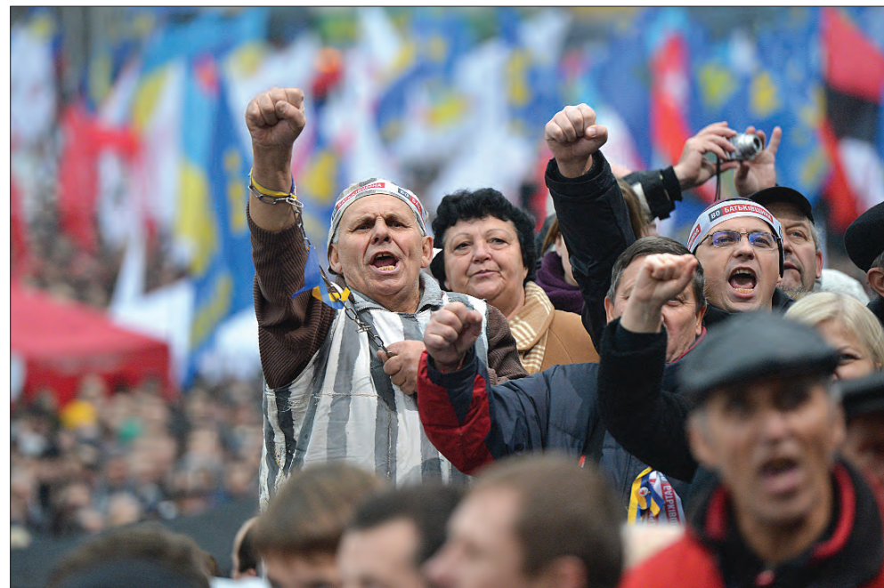
19 лютого 2014 року. Протистояння на Майдані Незалежності.