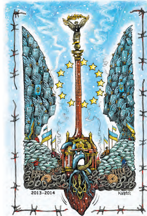
Майдан — територія Гідності та Свободи!