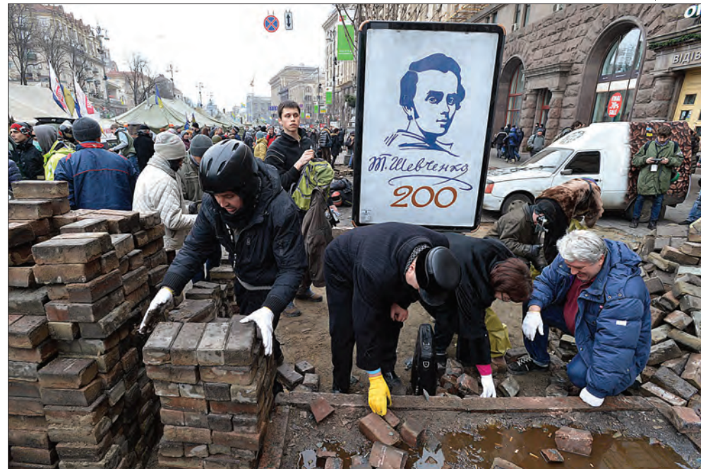
19 лютого 2014 року. Київ. Євромайдан.