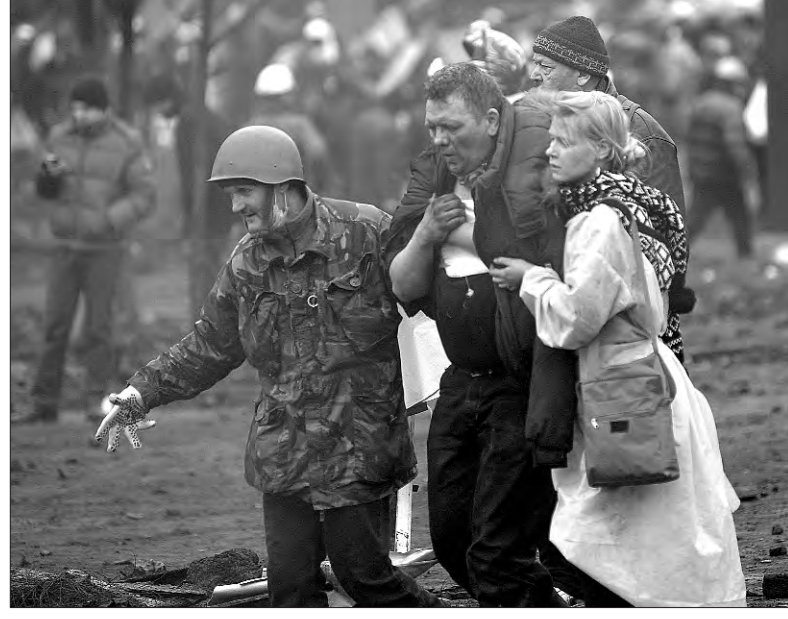
20 лютого 2014 року. Київ. Поранені під час протистояння на Євромайдані.