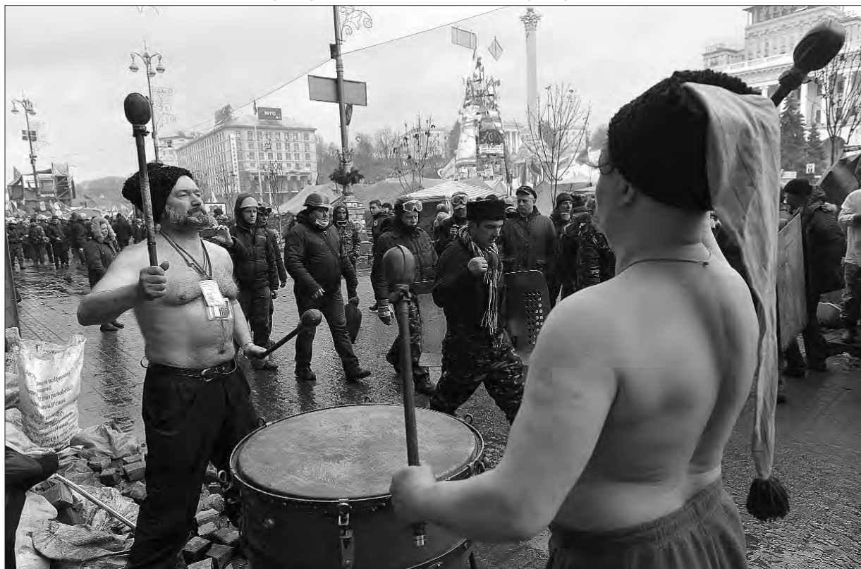
20 лютого 2014 року. Київ. Під час протистояння на Євромайдані.